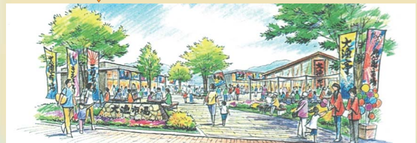
鹿折地区商店エリアの復興構想図