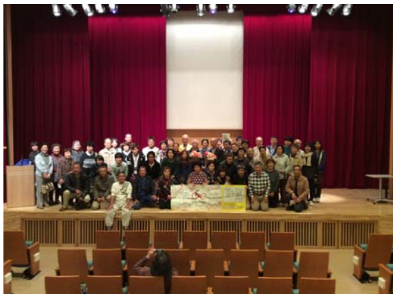
群馬公演終了後出演者スタッフ全員で