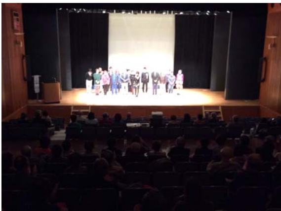
東京目黒区での公演光景