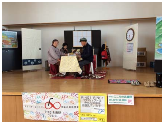
気仙沼市での公開練習光景